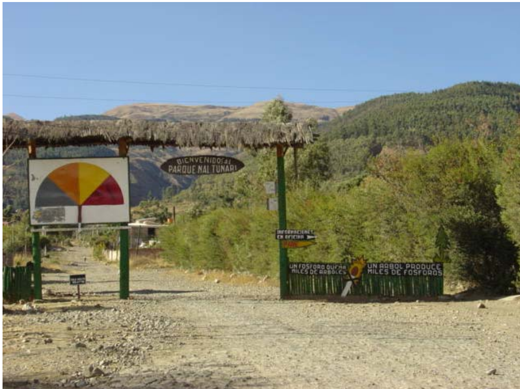
Entrada al Parque Nacional Tunari ,

Sus limites se extienden al norte desde la ceja de monte de la región de Tablasmonte, al sur desde la avenida Circunvalación (Av. Circunvalación II – cota 2750), que delimita el radio urbano de la ciudad de Cochabamba al este la quebrada de Arocagua y al oeste la quebrada de La Taquiña . todo contempla una extensión aproximada de 6.000 hectáreas 1 que varían desde los 2600 hasta los 4500 metros sobre el nivel del mar.