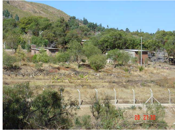
Pobres y ricos son vecinos en estos barrios.