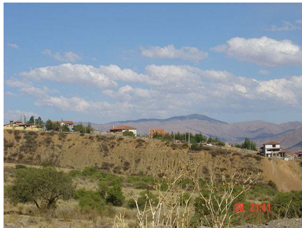
Vista trasera de las Lomas de Aranjuez